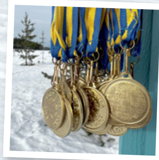
Medaljerna väntade vid målgången.