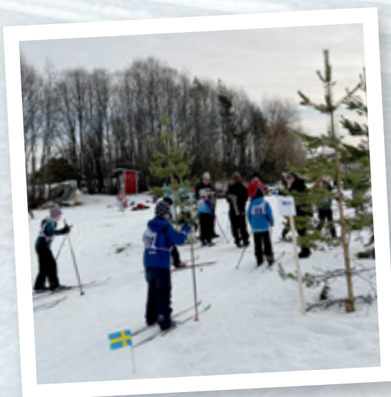
Äntligen målgång i "Mora" för alla glatt kämpande barn.